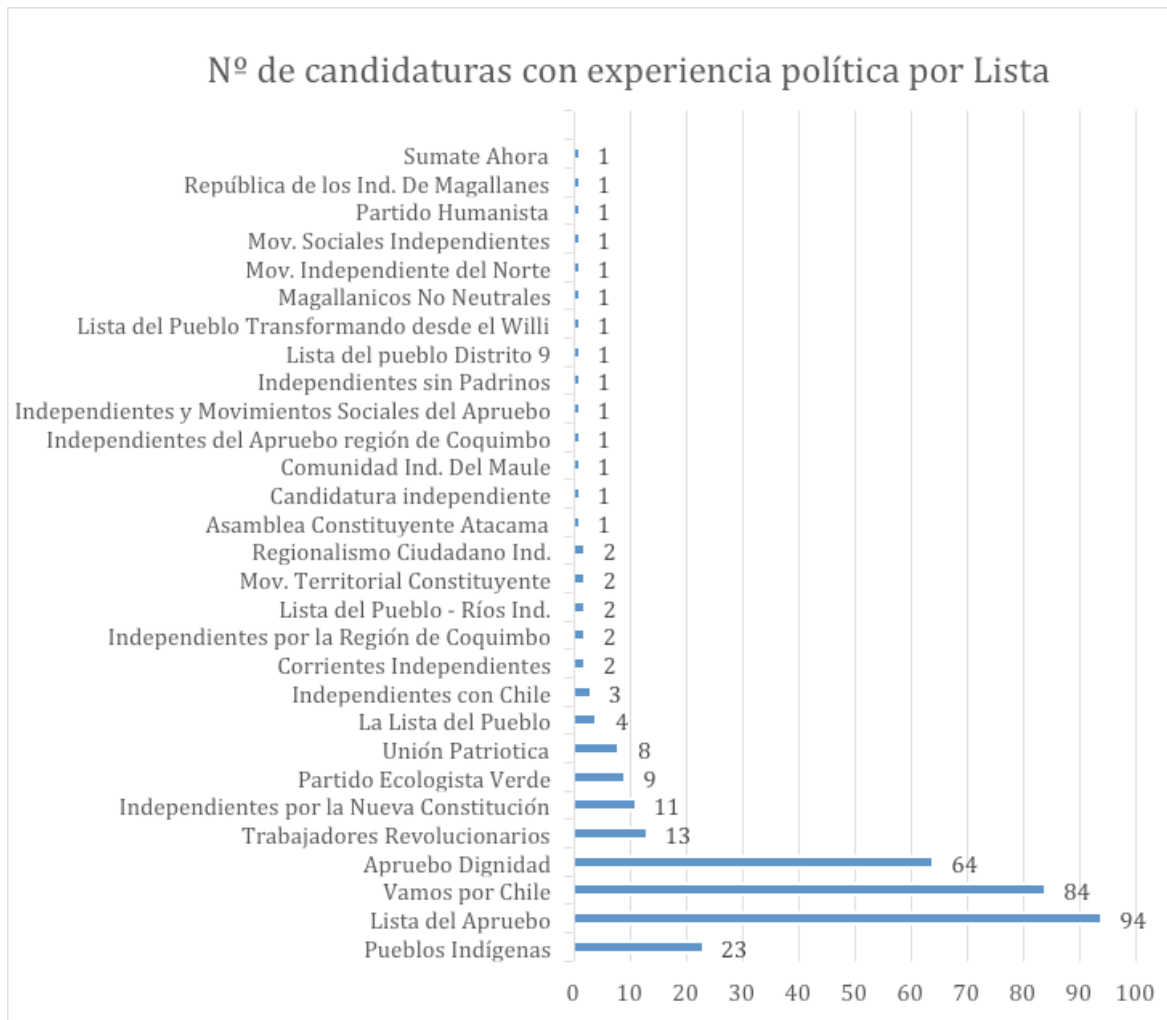
Gráfico 01: N° de candidaturas con experiencia política por lista.