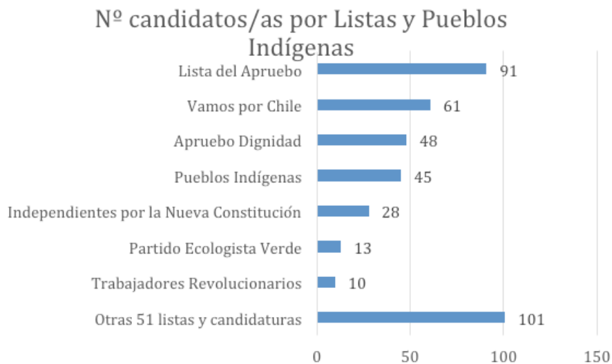
Gráfico 04: N° de candidatos/as por Listas y Pueblos Indígenas con experiencia pública

Fuente: Elaboración propia con datos de www.servel.cl y revisión de páginas web.